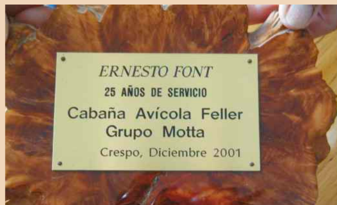
Placa por 25º años en Feller

Un valioso ejemplo de nuestra gente, de aquellos que saben de la importancia de que nada se logra sin perseverancia y que todo sacrificio, más allá de las dificultades, da sus frutos.