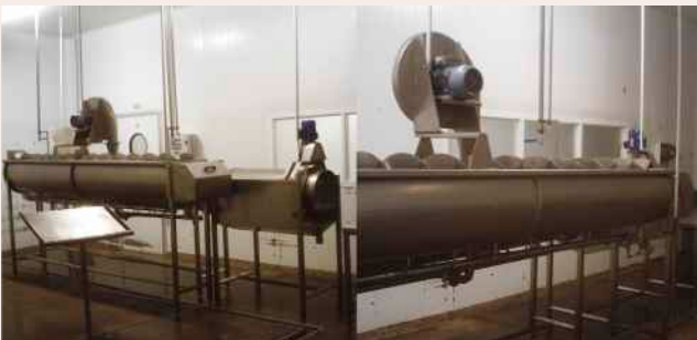
Sector procesado de crestas

Además se está trabajando, próximo ya a su puesta en marcha también, en la línea de procesado de garras de pollo, cuyo destino es la República China.