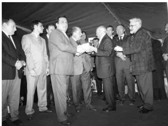
Directivos de Amural saludando al Gobernador durante el acto de inauguración

A continuación transcribimos la misma, porque todos debemos sentirnos orgullosos y gratificados con estas palabras y más aún, todos somos parte y contribuimos desde nuestro trabajo a que nos valoren de esta manera.