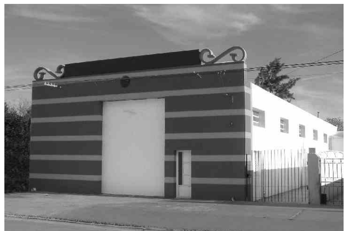
Nuevo edificio destinado en el futuro para Planta de Premezclas.