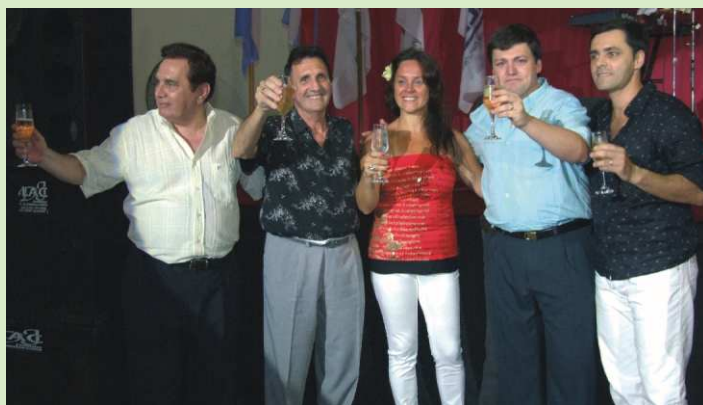
Fiesta fin de año 2008